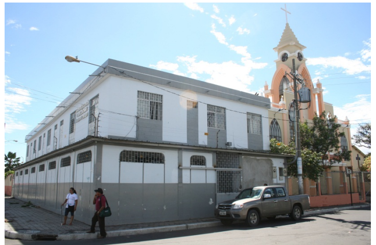
Fotos de la estructura actual