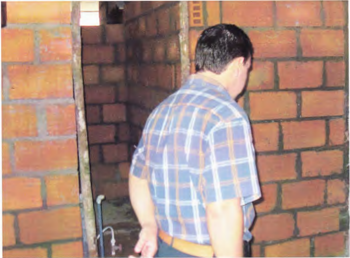
OBRAS DE READECUACIÓN DE LA CASA HOGAR DE LA MADRE SOLTERA