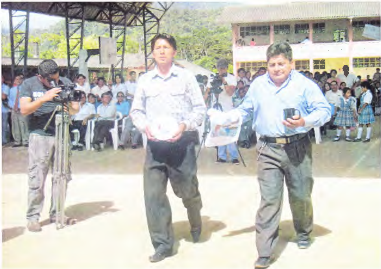
ARTESANIAS PRODUCIDAS POR LOS GRUPOS DE MESTIZOS Y SARAGUROS, TAMBIÉN HABITANTES DE CHICAÑA EN UN ACTO DE OFERTORIO DE UNA CELEBRACIÓN EUCARÍSTICA