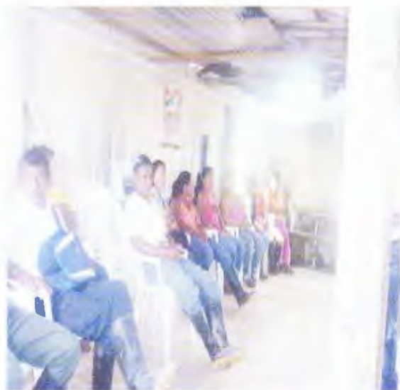
Capacitación al grupo meta, en