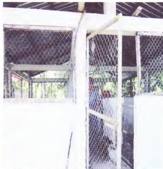
Adecuación de instalación de chanchora km 20