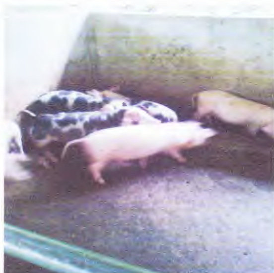
Cerdos seleccionados para la compra