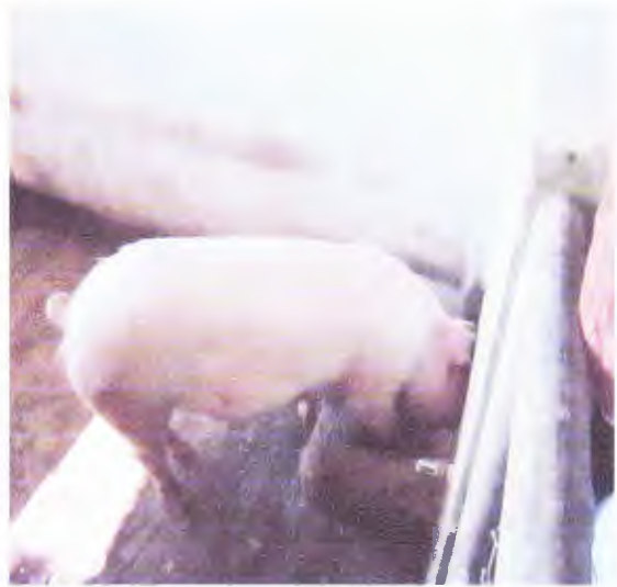
Cerdas instaladas en chanchera listas para empezar la reproducción.