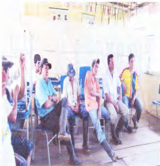
Reunión de planificación en la comunidad Cochras del Betano